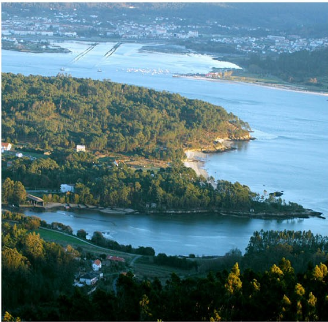
Praia de Broña vista dende Tremuzo